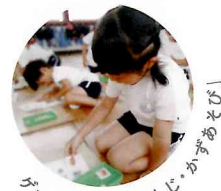
ゲームを通じて「もじ・かずあそび」