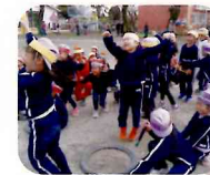
卒園リレー大会(3月)

【4月】入園式・お楽しみ会 【5月】春の遠足・どろんこ・色水遊び 【6月】 ぬたくり・じゃがいもほり・こどものアトリエ 【7月】お泊まり会 【8月】夏期 保育 【9月】運動会・ミニミニ運動会 【10月】劇団公演会・秋の遠足・ さつまいもほり・造形月間開始 【11月】造形月間・描画展 【12月】リレー 大会・もちつき・クリスマス会 【2月】表現発表会・ミニミニ発表会・消防署 との防火訓練・縄跳び大会・リレー大会 【3月】ひな祭り会・卒園リレー大会・ 年長を送る会・卒園式 ※この他に誕生会や保育参観などがあります。