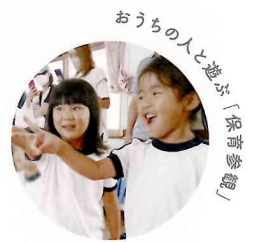
おうちの人と遊ぶ「保育参観」