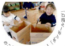
のこぎりだって使えるよ！「ダンボール遊び」