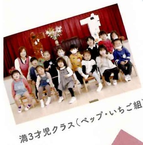
満3才児クラス(ベップ・いちご組)