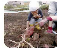
さつまいもほり(10月)