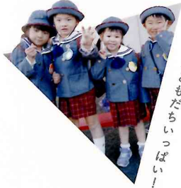
おともだちいっぱい！