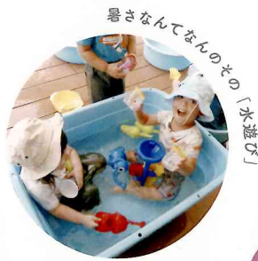
暑さなんてなんのその「水遊び」