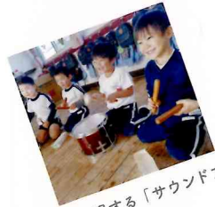
音で表現する「サウンドプレイ」