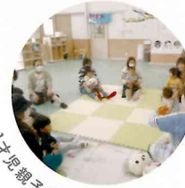
「子見親子教室(ポップ)」